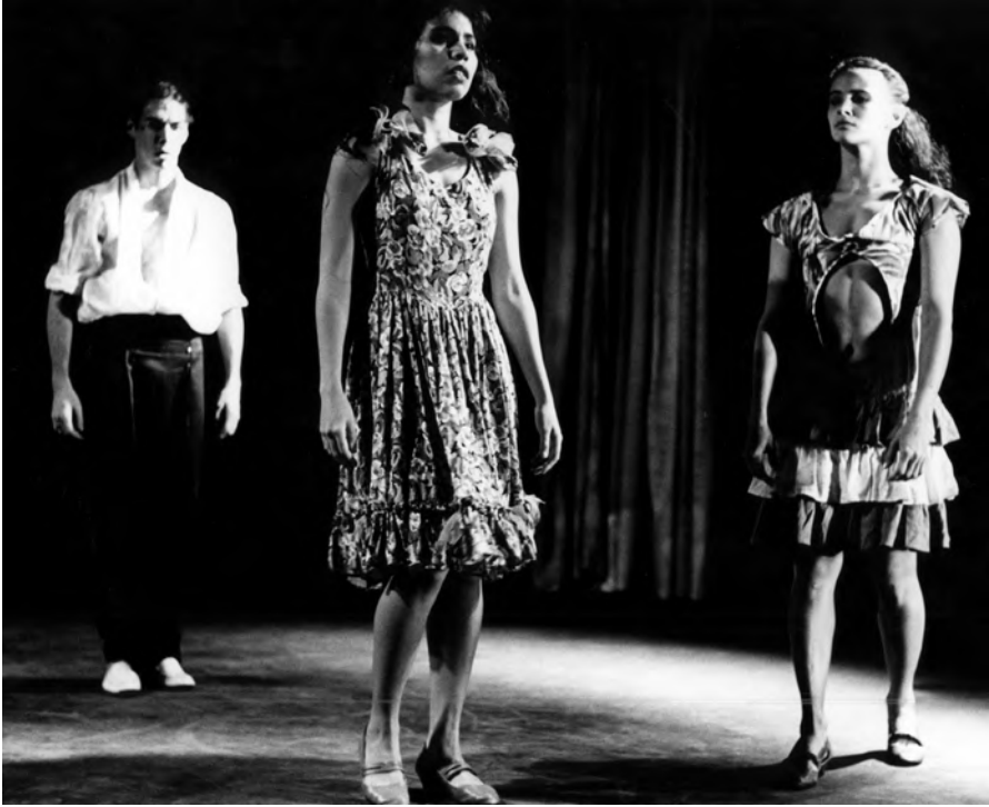
Vastos y Ajenos. 1991.