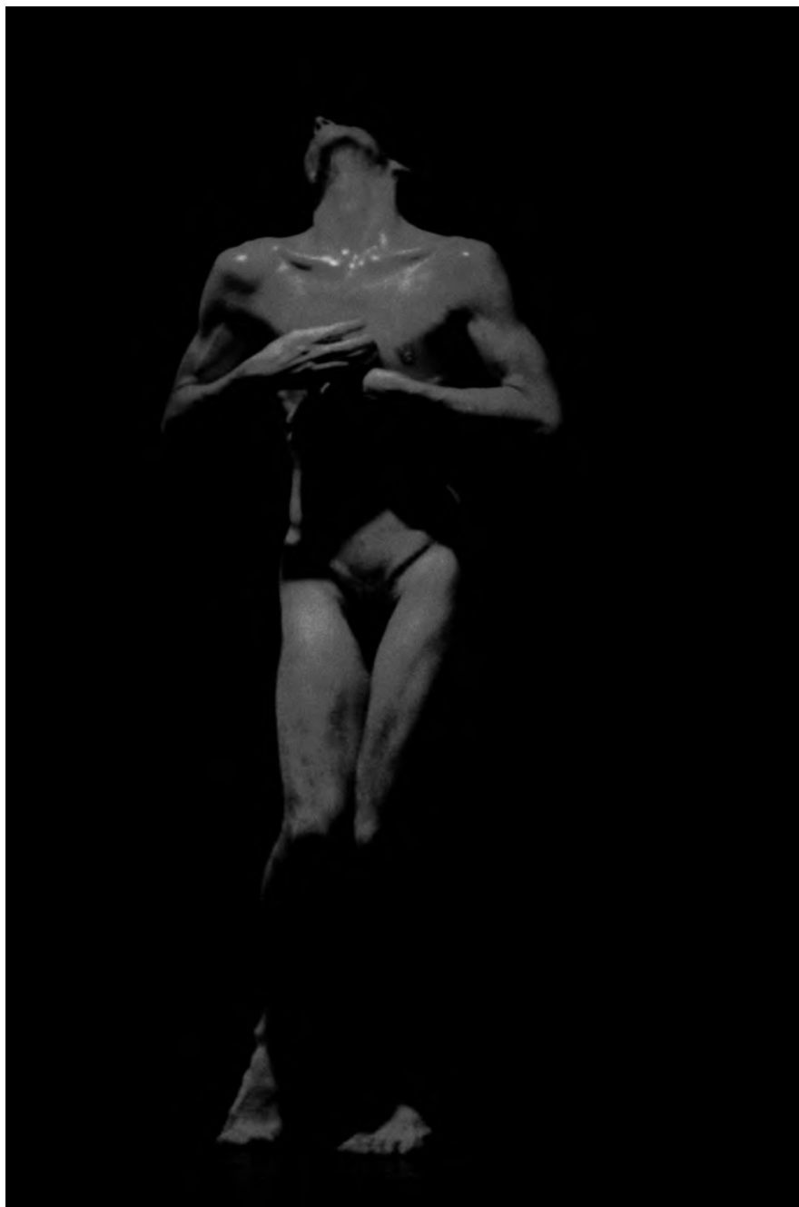
Rosas rojas. Urinarios rosas. 1994.