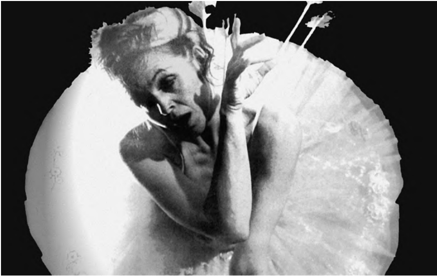
Delicada decapitación. 1999.