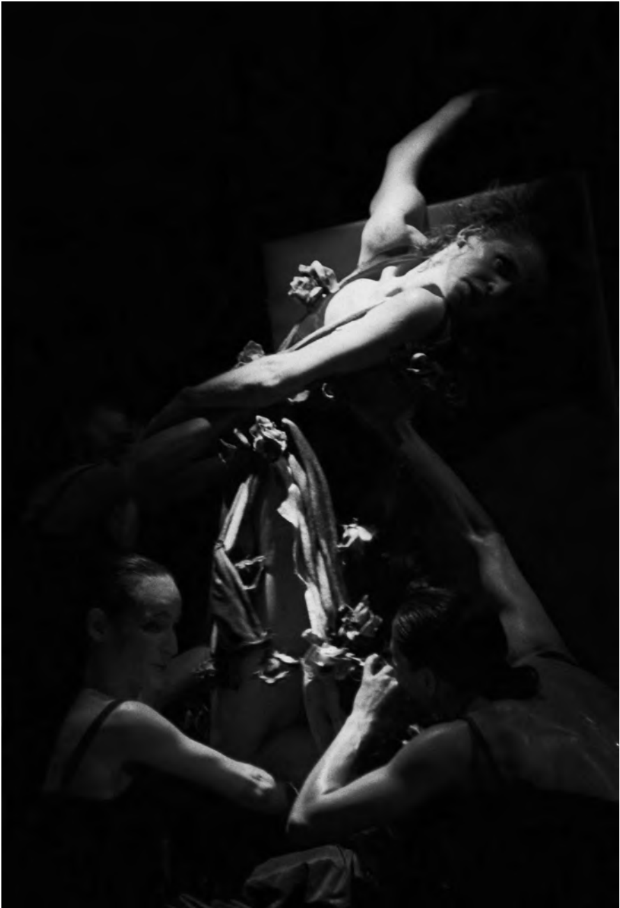
Rosas rojas, urinarios rosas.