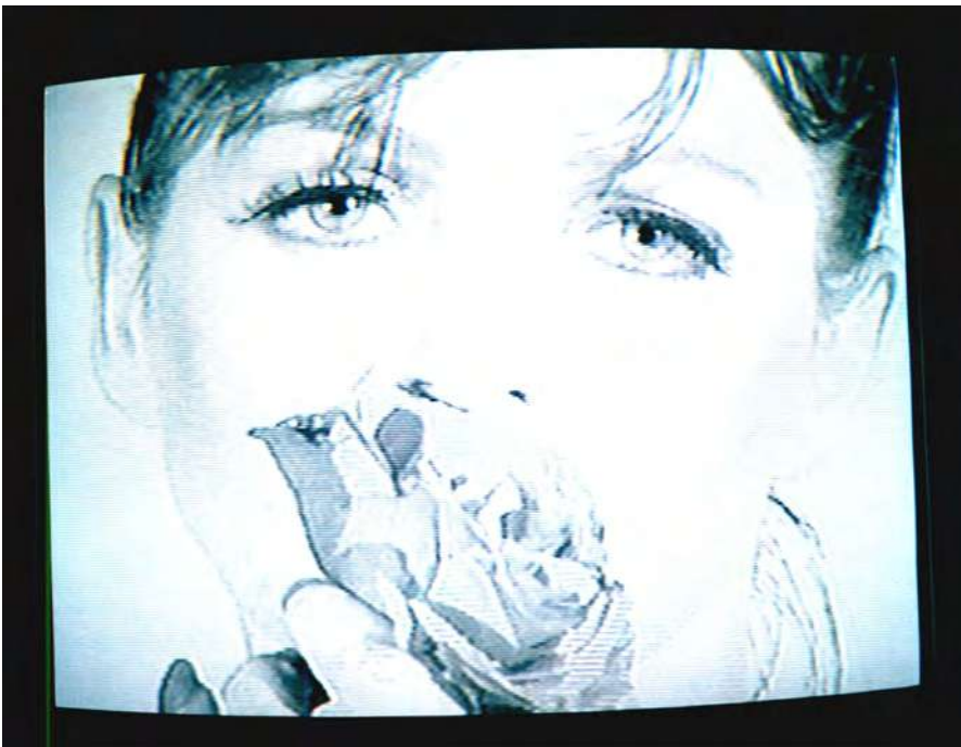
Delicada decapitación. 1999.