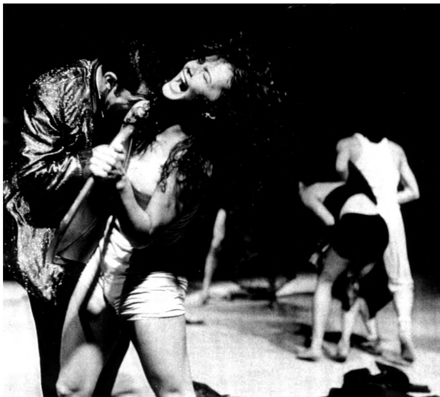
Moonlite and Roses. 1990.