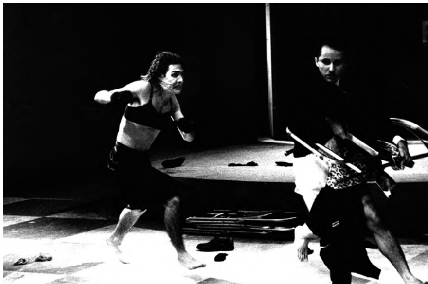
Moonlite and Roses. 1990.