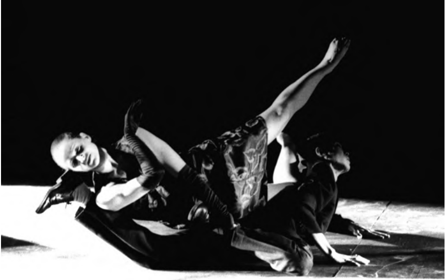
The Rainbow Dance. 1987.