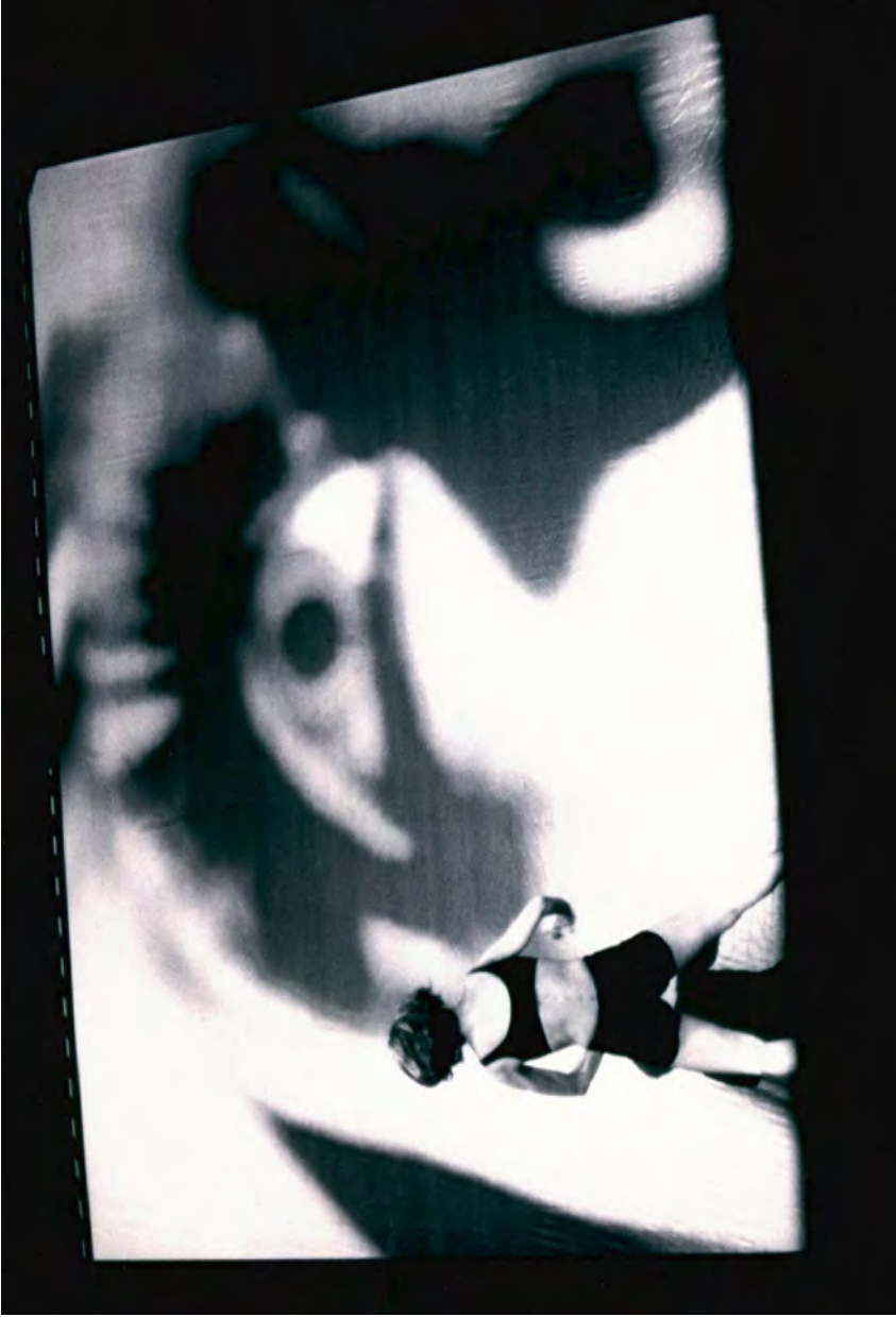
La rosa mutilada. 2000.